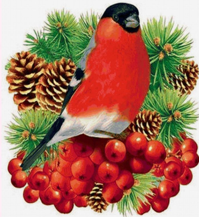
Сапунова Наташа 4 Е