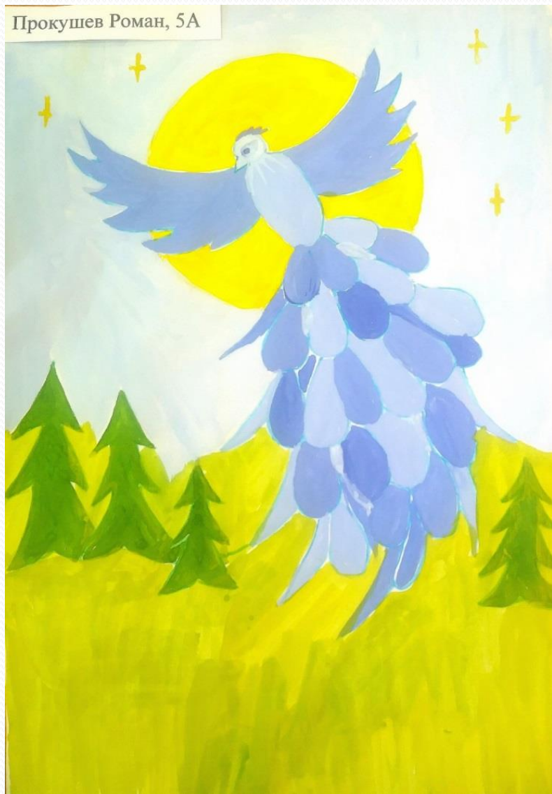
Прокушев Роман, 5А