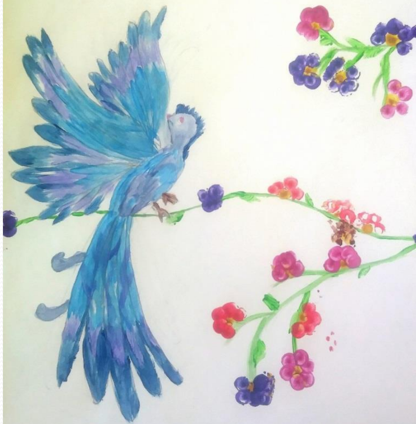
Казазаев Ярослав, 5А