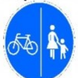
Дорожка для пешеходов и