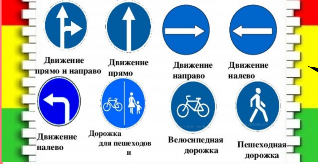
Движение прямо и направо